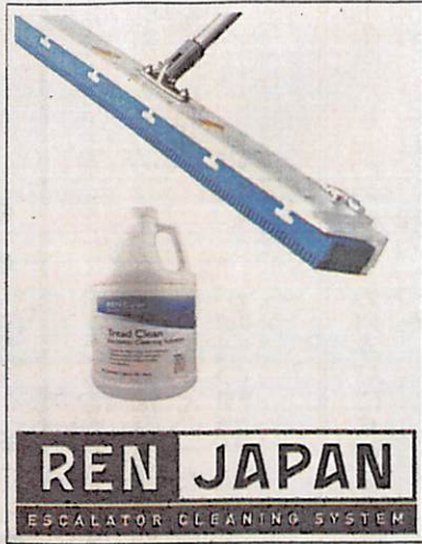
クリーニングパッド(上)とトレッドクリン(下)

込むことを実現。エスカレーターの踏み板と同じ幅の「エンジンリアド・クリーニングパッド」を使用し、溝の奥深くまでフィットして機能する。クリーニングパッドは、硬さ(柔軟性)の違う2種類の特殊スポンジを特殊技術で一体化したもので、国際特許によって他には真似のできないものとなっている。